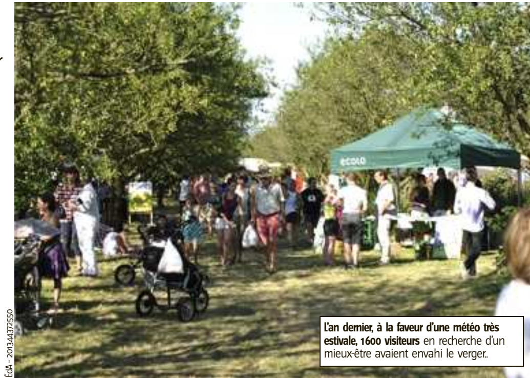
L'an dernier, à la faveur d'une météo très estivale, 1600 visiteurs en recherche d'un mieux-être avaient envahi le verger.

raîchage écologique et le petit élevage, cette 5 e fête au verger mettra la paille à l'honneur.